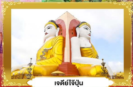
เจดีย์ไข่มุก