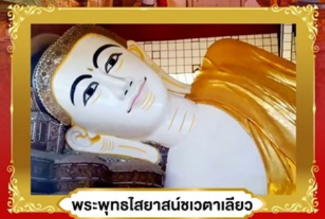
พระพุทธรูปไสยาสน์ชเวตาเลียว