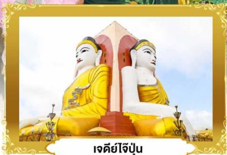
เจดีย์ใจปูน