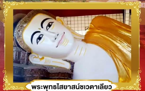
พระพุทธรูปไสยาสน์ชเวดากอง