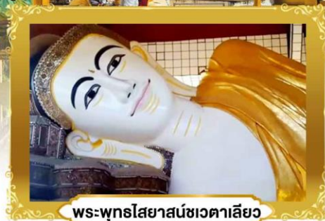
พระพุทธรไสยสน์ชเวตาเลียว