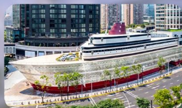
เรือทลุยส์วิตตอง