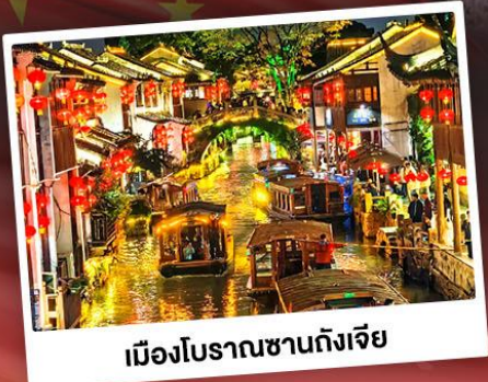
เมืองโบราณซางตงเจีย