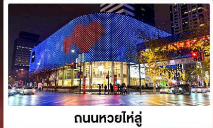
ถนนหอยไหล่