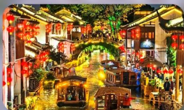
เมืองโบราณซานกิงเจีย