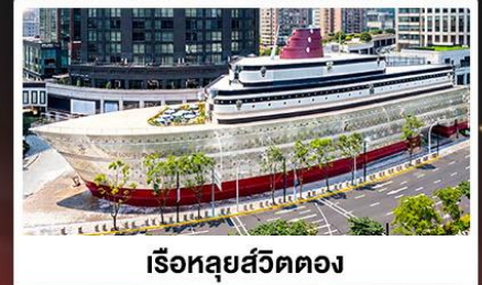
เรือหลุยส์วิคตอง