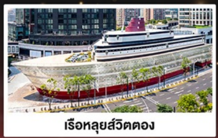
เรือหลุยส์วิตตอง