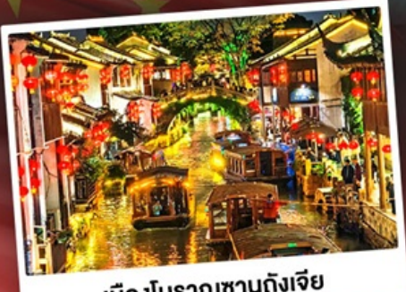
เมืองโบราณซางงังเจีย