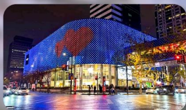
ถนนหยูไห่ลู่