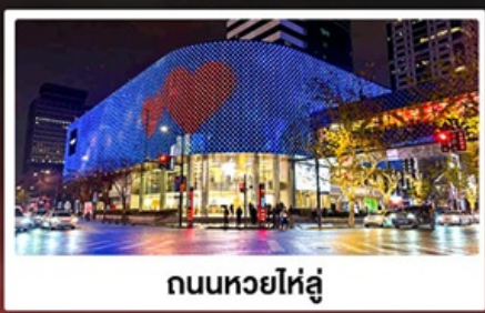
ถนนหวยไห่หลู่