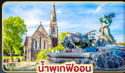
น้ำพุเทพีออน