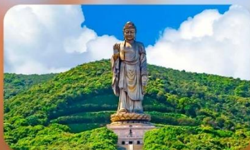
พระใหญ่หลิงชาน