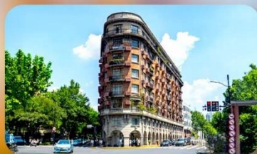
ถนนอู๋คิง