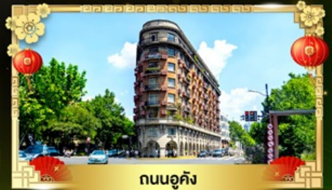
ถนนอูคิง