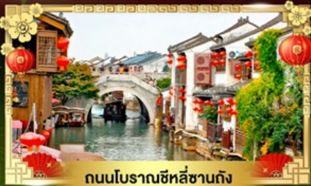
ถนนโบราณซีหลี่ซานตง

เดินทางสัมผัสแดนแดนจีนสุดล้ำ ชิมอาหารถิ่นซูโจว สักการะพระใหญ่หลิงซานต้าฝอ ชมทะเลสาบซีหู