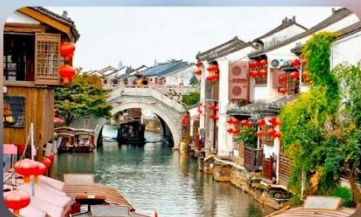
ถนนโบราณซีหลี่ชานกง