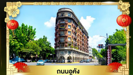
ถนนอูคิง