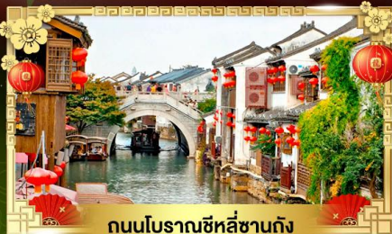
ถนนโบราณซีหลี่ชานตง

เดินทางสัมผัสแดนแดนจักรวาลล้ำลึกชิมอาหารถิ่นซูโจว สักการะพระใหญ่หลิงชานต้าฝอ ชมทะเลสาบซิดู