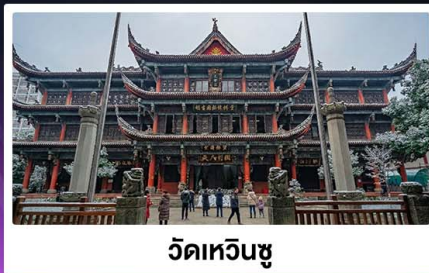
วัดเหวินซู