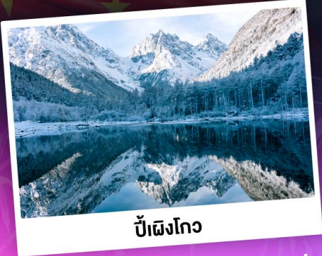
ป่าเผิงโกว

ท่องเขาแอลป์เมืองจีน "ภูเขาสี่ดรุณี" ชมความสวยงามของอุทยานป่าเผิงโกว