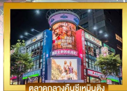
ตลาดกลางคืนซีเหมินติง