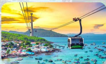
Hon Thom Island