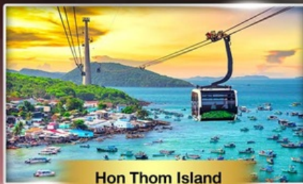
Hon Thom Island