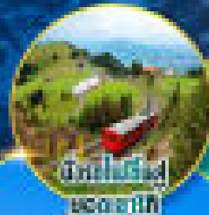
เมืองซ็องต์-มอริซ