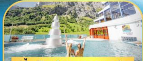
แช่น้ำแร่ร้อนผ่อนคลายคอร์มัท