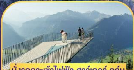
นั่งรถกระเช้าไฟฟ้า ฮาร์เตอร์ คูล์ม