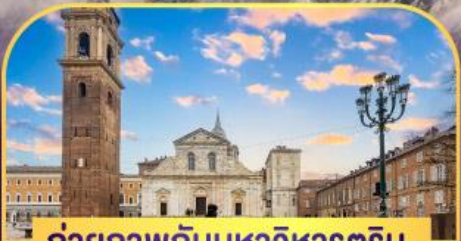
ถ่ายภาพกับมหาวิหารตูริน