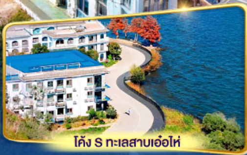
โค้ง S ทะเลสาบเอ๋อไห่