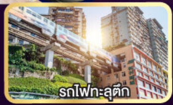
รถไฟทะเลสาบ