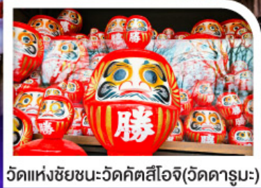
วัดแห่งชัยชนะ-วัดคัตสึโอะจิ(วัดคารุมะ)