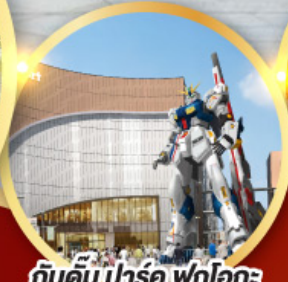
กินคิม ปาร์ค ฟุกุโอกะ