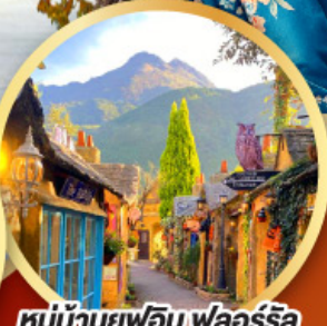
หมู่บ้านยูฟูอิน ฟลอร์ริล