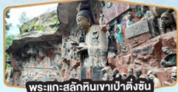
พระแกะสลักหินเขาเป่าตั้งชัน