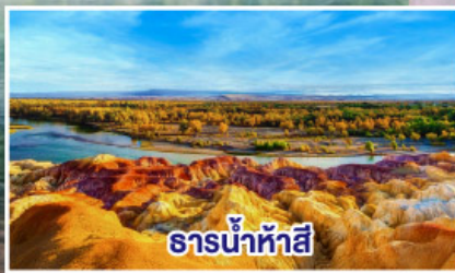
ธารน้ำห้ำสี