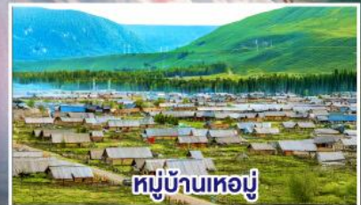
หมู่บ้านห่มู