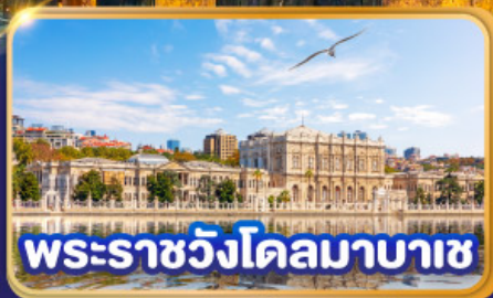
พระราชวังโดลมาบาซ