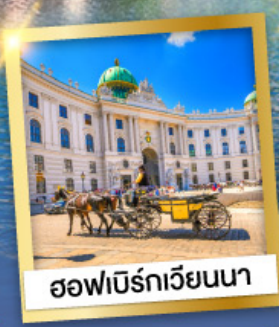
ออฟนิร์กเวียนนา