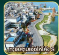
ทะเลสาบเอ๋อไห่โค้ง S