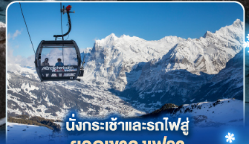
นั่งกระเช้าและรถไฟสู่ ยอดเขาจุงเฟรา