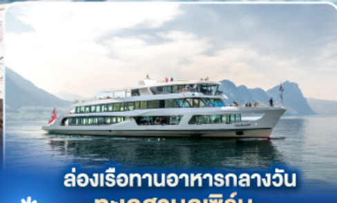
ล่องเรือทานอาหารกลางวัน ทะเลสาบลูซีร์น