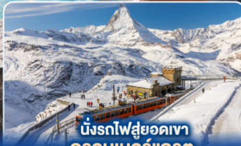
นั่งรถไฟสู่ยอดเขา กรอนเนอร์เกรต