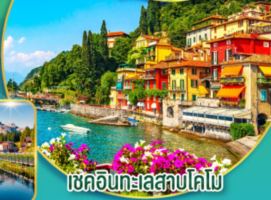
เชคอินทะเลสาบโคโม