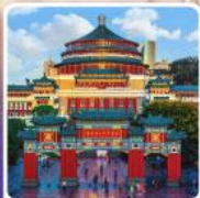
ศาลาประชาคมฉงชิ่ง