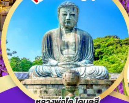
หลวงพ่อโต ไคบุคสึ