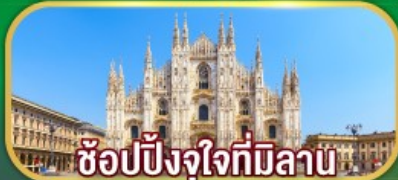
ซอปปิงจุงใจที่มิลาน