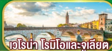
เวโรน่า โรมีโอและจูเลียต

เดินทาง 07-14 เม.ย. 69 / 02-09 พ.ค. 69 27 พ.ค. - 03 มิ.ย.69 / 17-24 มิ.ย.69 22-29 ก.ค. 69 / 11-18 ส.ค. 69 16-23 ก.ย. 69