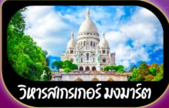
วิหารสกรเทอร์ มงมาร์ต