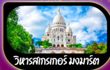
วิหารสกรเกอร์ มงมาร์ต