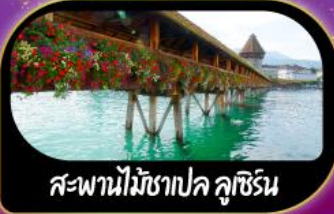
สะพานไม้ชาเปล คูชีริน