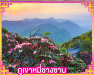
ภูเขาหมีซางซาน