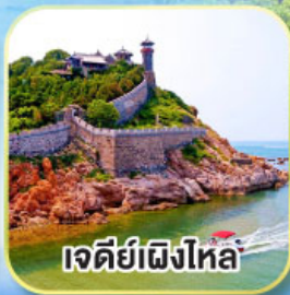
เจดีย์เฝิงโหล