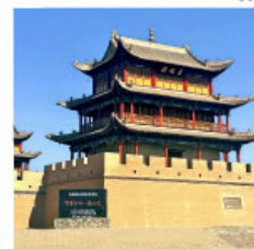
ถ้าแพงเจียยี่กวน