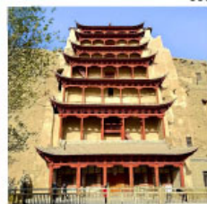
ถ้าม่อเกา