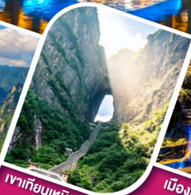
เขากียนเหมินซาน