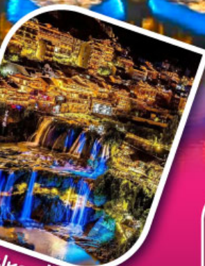
เมืองฝูหลงเจิน