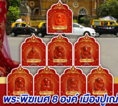
พระพิฆเนศ 8 องค์ เมืองปูเน่

" อินเดียครั้งนี้ ไม่ใช่แคร์ิป แต่คือการเปลี่ยนแปลง ปลุกพลังในตัวคุณ... ด้วยพิธีกรรมศักดิ์สิทธิ์ ณ สถานที่จริง ของพระพิฆเนศ ดินแดนแห่งปญญาและพรสูงสุด"