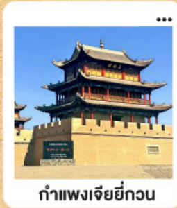
ถ้ำแพงเจียยี่กวน