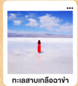
ทะเลสาบเกลือฉางซ่า