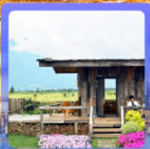
ร้านกาแฟหุบเขาคีอั้น