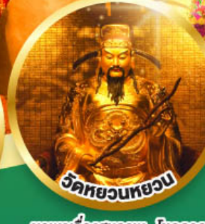
เจ้าแม่กวนอิมรับพลานามัย