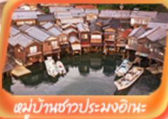
หมู่บ้านชาวประมงอิหะ