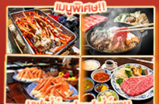
บุฟเฟ่ต์ญี่ปุ่นบุฟเฟ่ต์ซาซุ ปิ้งย่างยากิnikuในอัน Steakland Kobe