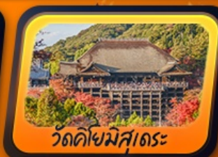
วัดคิโยมิสุเดระ