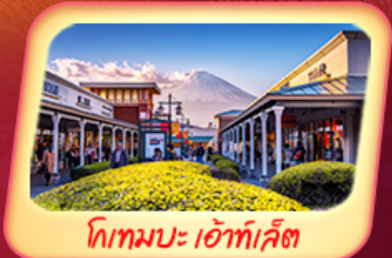
โทกเมบะ เอ้าท์เล็ต