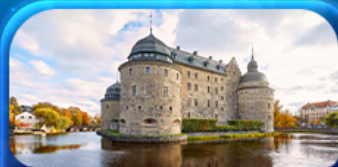
ปราสาทโฮลัม