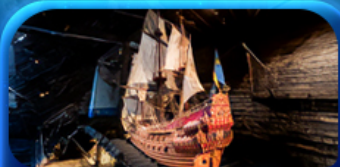
พิพิธภัณฑ์ทิวาชา