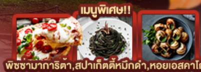
เมนูพิเศษ!! พชชาภากริตา, สปลาเก็ดคิทหมักดำ, หอยเอสคาโท