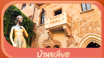
บ้านลูเลียง