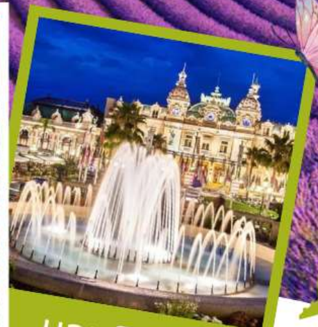
มอนติคาร์โร