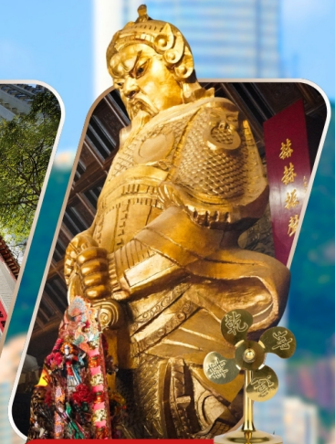
CHE KUNG (SHA TIN)