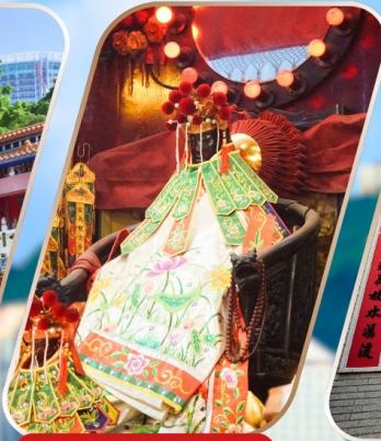
KWAN YUM HH