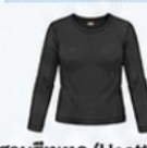
สวมฮีทเทค (Heattech) แบบหนาพิเศษด้านใน