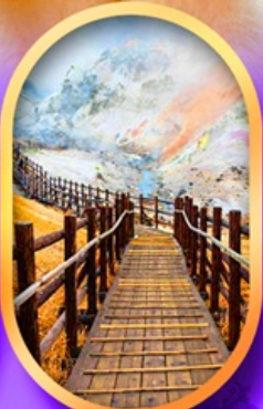
จิกุคคาบิ