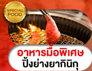
อาหารมือพิเศษ ปิ้งย่างยากินิกุ