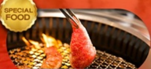
อาหารมือพิเศษ ปิ้งย่างยากินิกุ