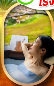
แช่บ่อออนเซ็นญี่ปุ่น