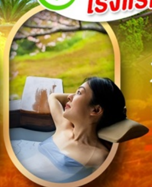
แช่ม่ออนเซ็นญี่ปุ่น