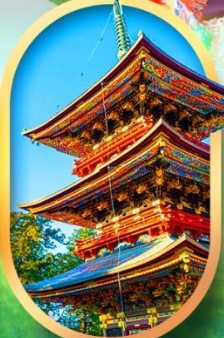
วัดนาริตะ-ซัง