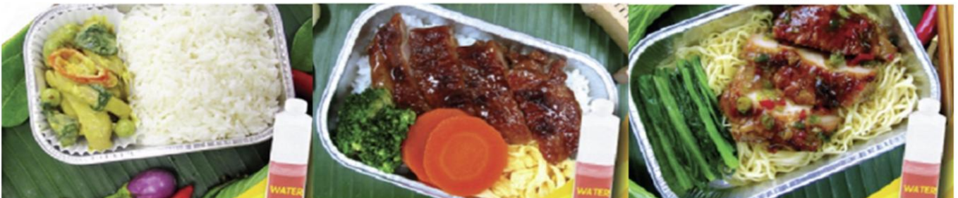
Green curry chicken with rice and water Chicken teriyaki with rice and water Chicken roasted with herb and noodle and water

*** เมนูอาหารอาจมีการเปลี่ยนแปลง ทั้งนี้ขึ้นอยู่กับเที่ยวบิน ***