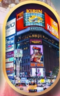
ซื้อบั้งย่านซุกิโนะ