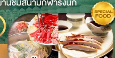
เมนู สุกี้ม้งโก + เปิดปักกิ่ง เดินทาง เม.ษ. - ต.ค. 69