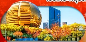
City Balcony จุดชมวิวชื่อดังในทางโจว

เชียงใหม่ หางโจว ดิสนีย์ สวนสนุกเลโก้แลนด์