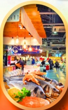
ตลาดปลาฮิโงโตะ