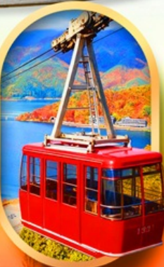
ขึ้นกระเช้าทะเลสาบมิกะตะ