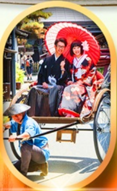
เมืองเก่าทาคายามา