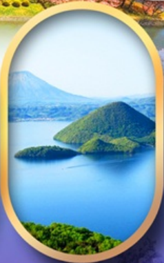
วิวทะเลสาบโทโยะ