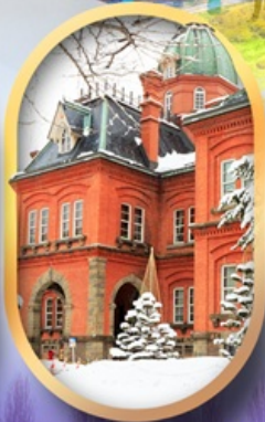
ศาลาว่าการฮอกไกโด