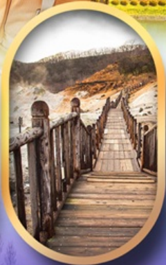
หุบเขาจิกุกดาบิ