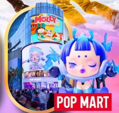
ถนนหนานจิง