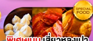
พิเศษเมนูเสี่ยวหลงเปา หมูตงพ้อ ไก่จอกาน เดินทาง ม.ค. - มี.ย. 69